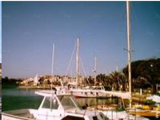
port de plaisance