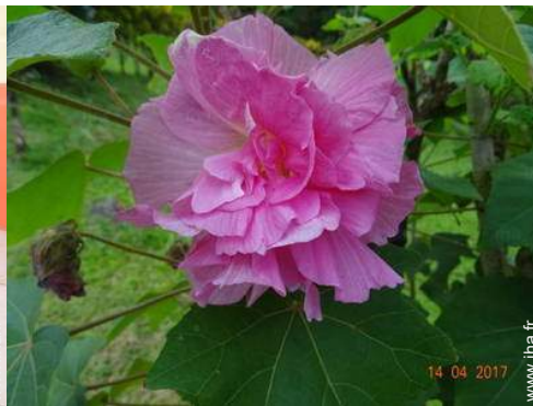
vue depuis la terrasse couverte