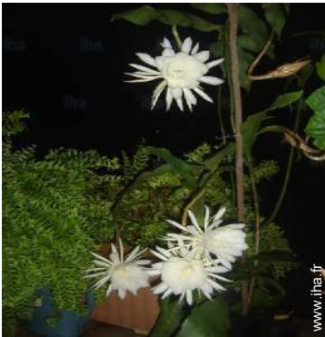
vue depuis la terrasse couverte