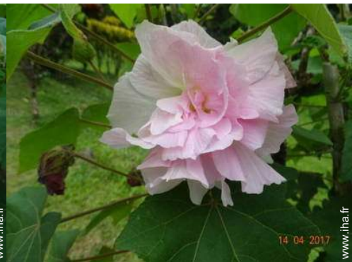
vue depuis la terrasse couverte