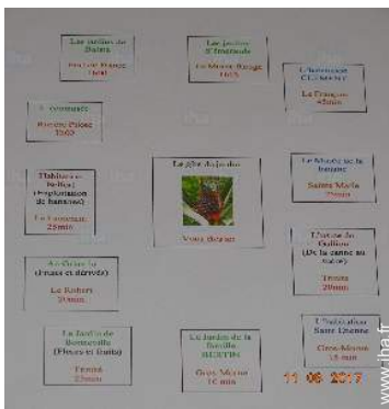
parc et jardin