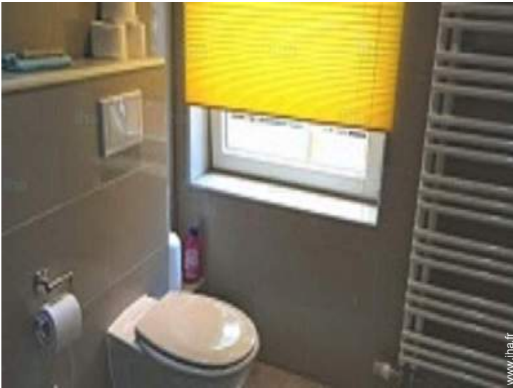
salle(s) de bain