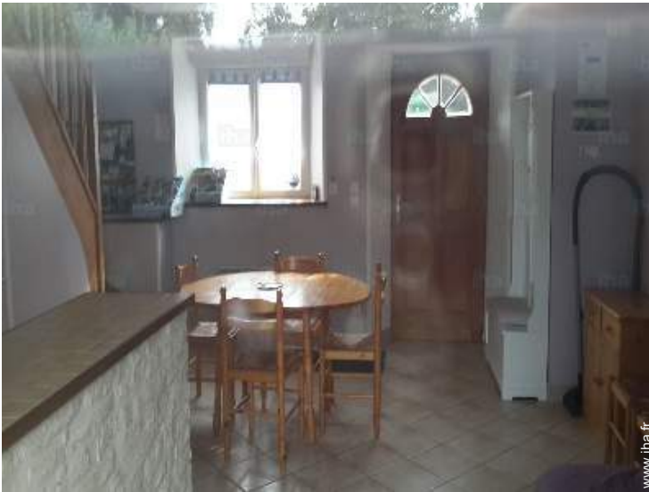
vue depuis la cuisine