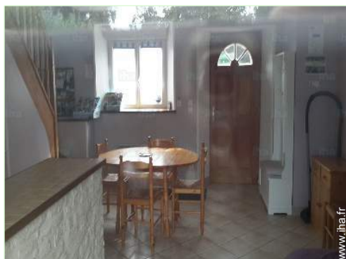
vue depuis la cuisine