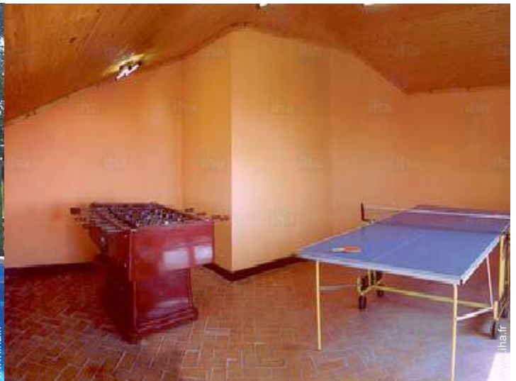
salle de jeux