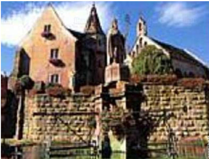
vue sur village