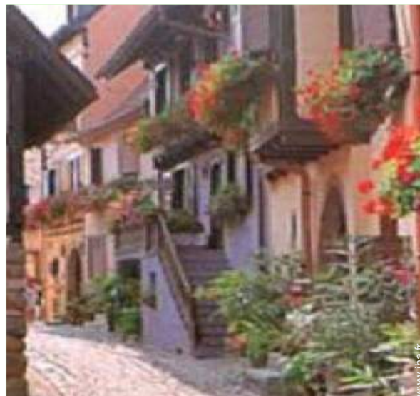
vue sur rue piétonne