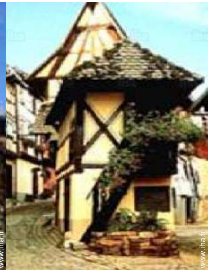
vue sur village