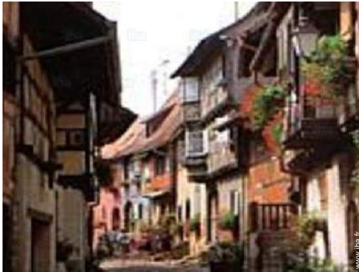
vue sur rue piétonne