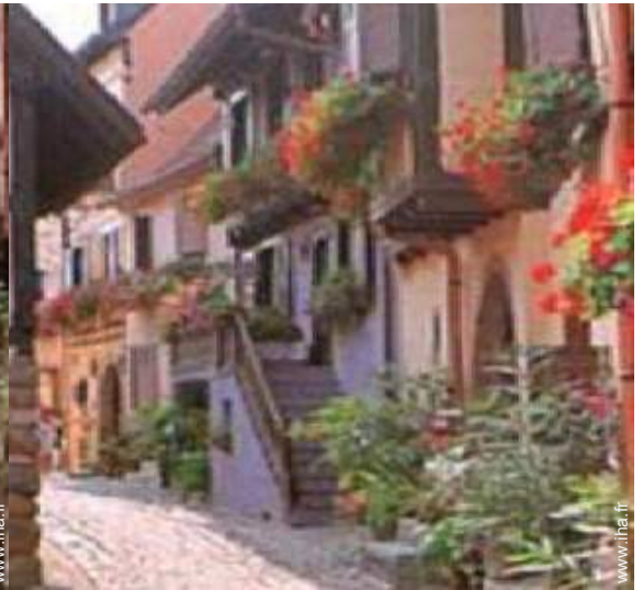
vue sur rue piétonne