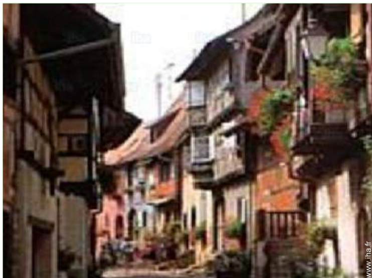
vue sur rue piétonne