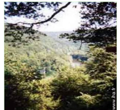
vue sur rivière