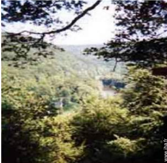
vue sur rivière