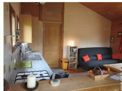
canapé-lit(s) 2 pers