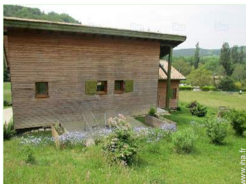
vue depuis la terrasse