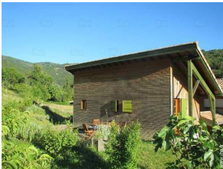
vue depuis le jardin/parc