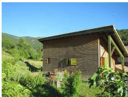
vue depuis le jardin/parc