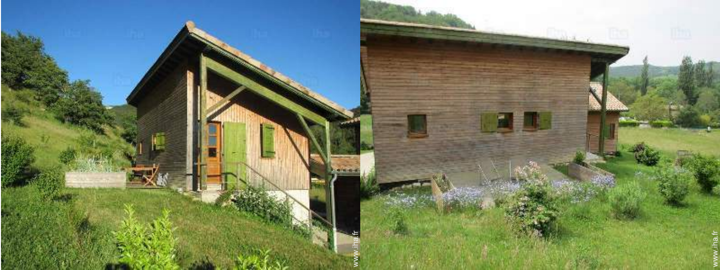
vue depuis la terrasse