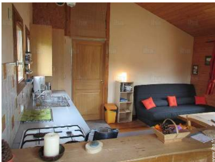
canapé-lit(s) 2 pers