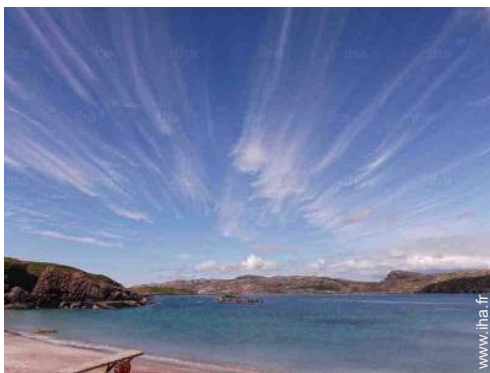
vue sur mer