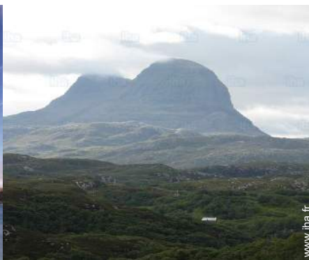
loisirs de montagne à proximité