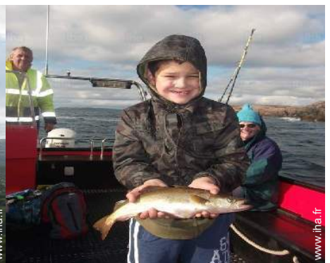
pêche au gros