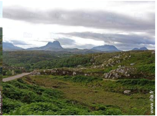
loisirs de montagne à proximité