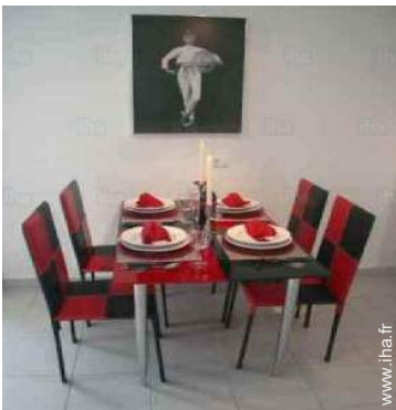
Agencement intérieur et commodités