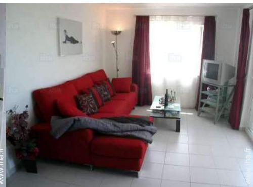
Confort intérieur et équipements