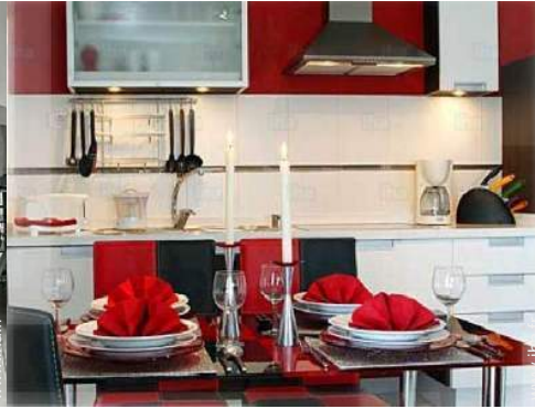
Agencement intérieur et commodités