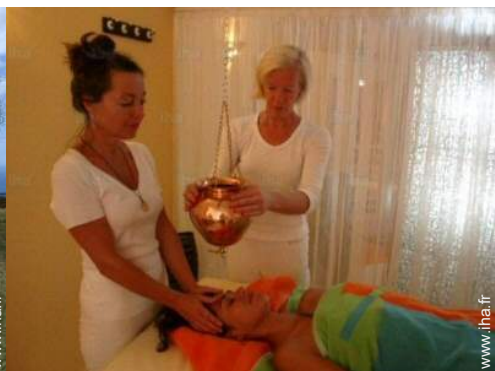
soin de beauté