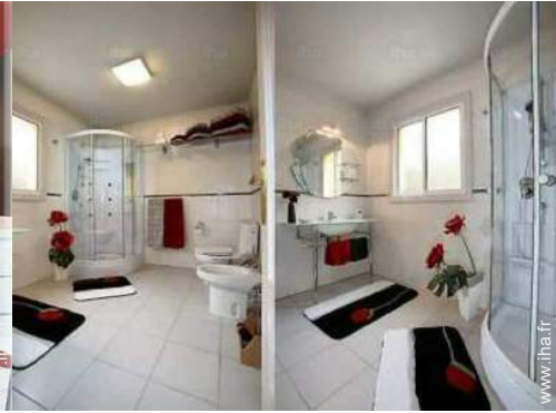
Agencement intérieur et commodités