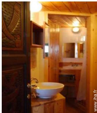
salle(s) de douche