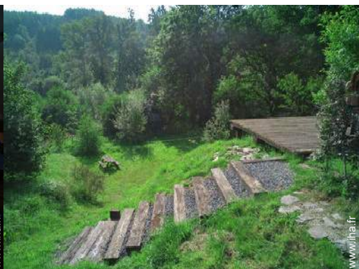
Cadre extérieur à disposition des hôtes