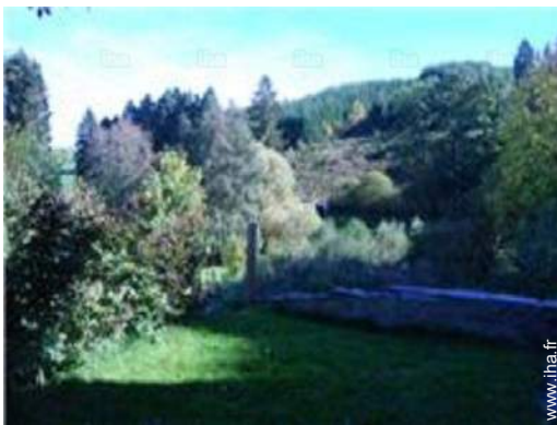
Cadre extérieur à disposition des hôtes