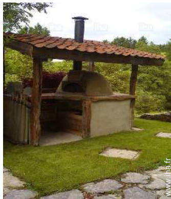
four à pizza