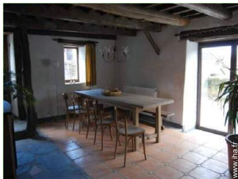
salle à manger