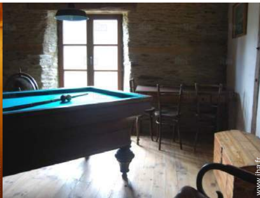
table de billard