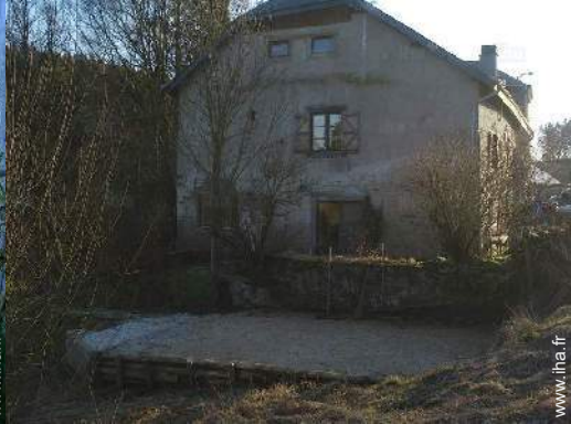
terrain de pétanque