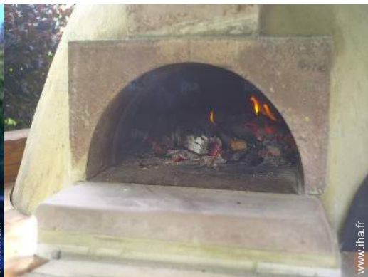
four à pizza