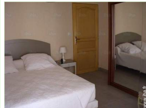
Couchage - lit(s)