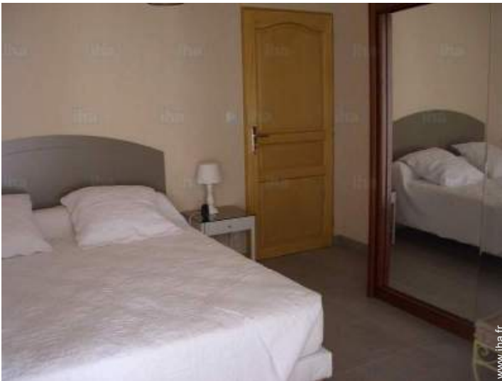
Couchage - lit(s)