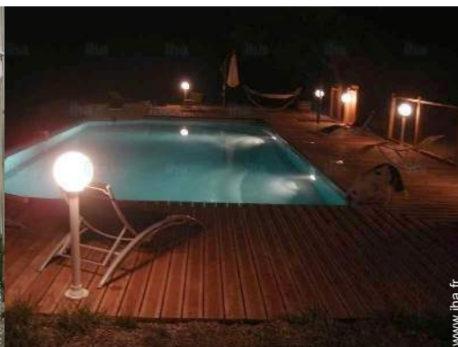
vue sur piscine