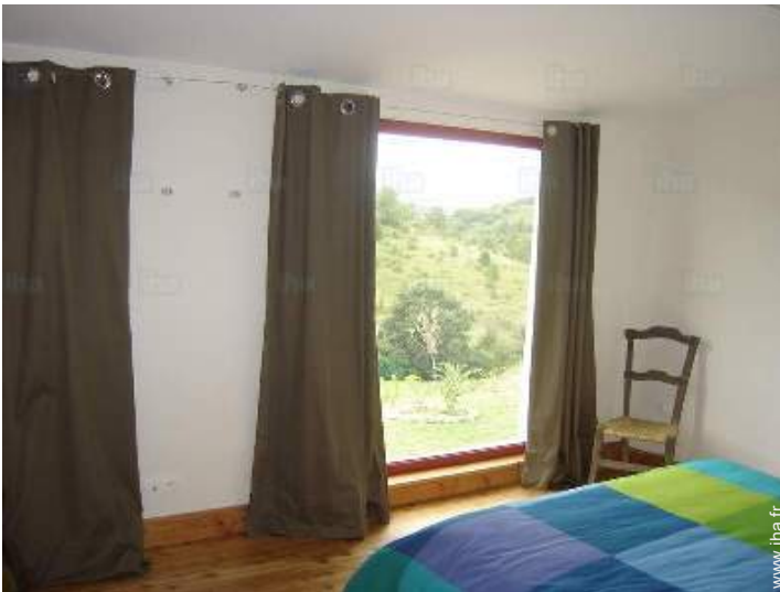
vue depuis la chambre