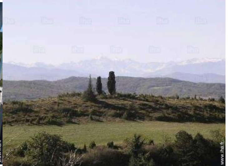
vue depuis la maison