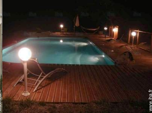
vue sur piscine