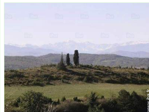
vue depuis la maison