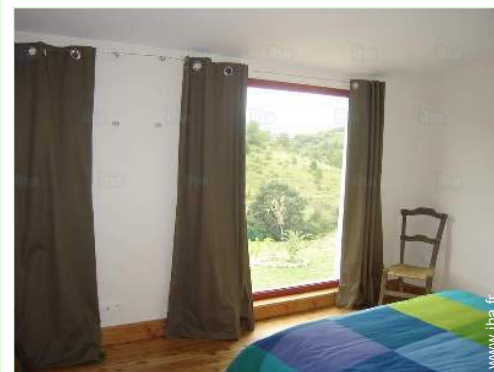
vue depuis la chambre

Garderie <50m Centre ville 7,5km Arrêt/station de bus 7,5km Liaison bus pistes de ski 7,5km Location de vélo/VTT 15km Location de voiture 7,5km Location de matériel de ski 25km Boulangerie 7,5km Traiteur 5km Petits commerces 7,5km Super marché 7,5km Salon de coiffure 7,5km Poste 7,5km Banque 7,5km Distributeur automatique de billets 7,5km Pharmacie 7,5km Médecin 7,5km Infirmière 7,5km Hôpital 20km