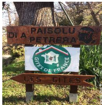
Présence sur place