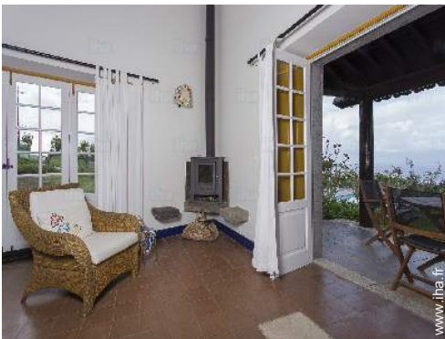
vue depuis le séjour