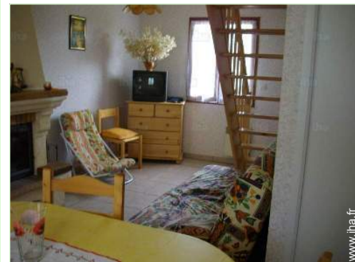
Agencement intérieur et commodités