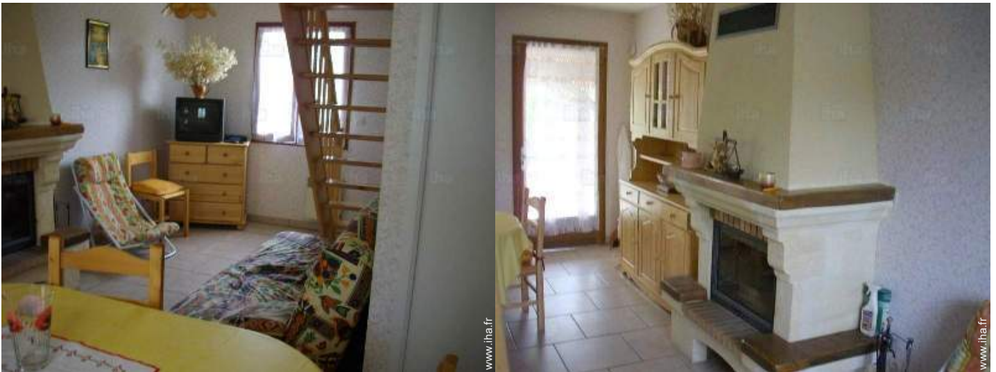
Agencement intérieur et commodités