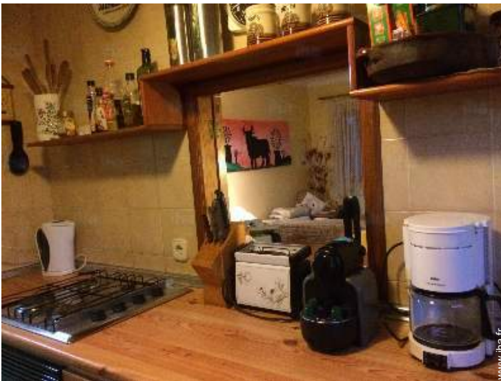
Confort intérieur à disposition des hôtes