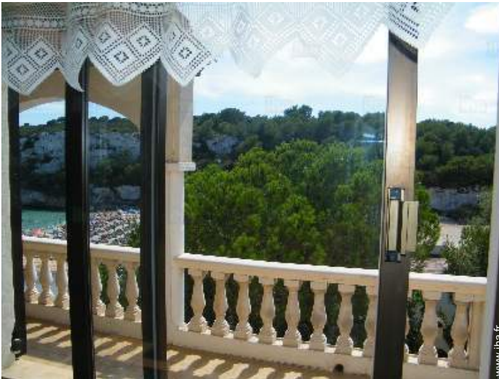
vue depuis la cuisine