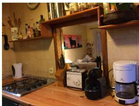
Confort intérieur à disposition des hôtes