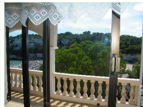
vue depuis la cuisine

Mer/océan <50m Plage de sable <50m Plage de naturisme 4km Court de tennis public 800m Parcours de golf 9 trous 15km Parcours de golf 18 trous 15km Base aéronautique >50km Spot de windsurf 15km Spot de surf 15km Base nautique 5km Port de plaisance 5km