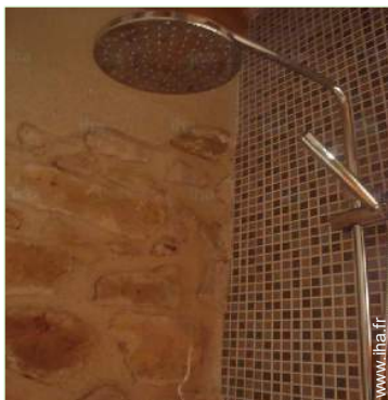
salle(s) de bain