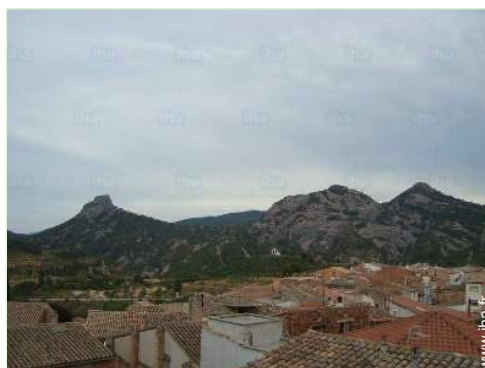
vue depuis la terrasse