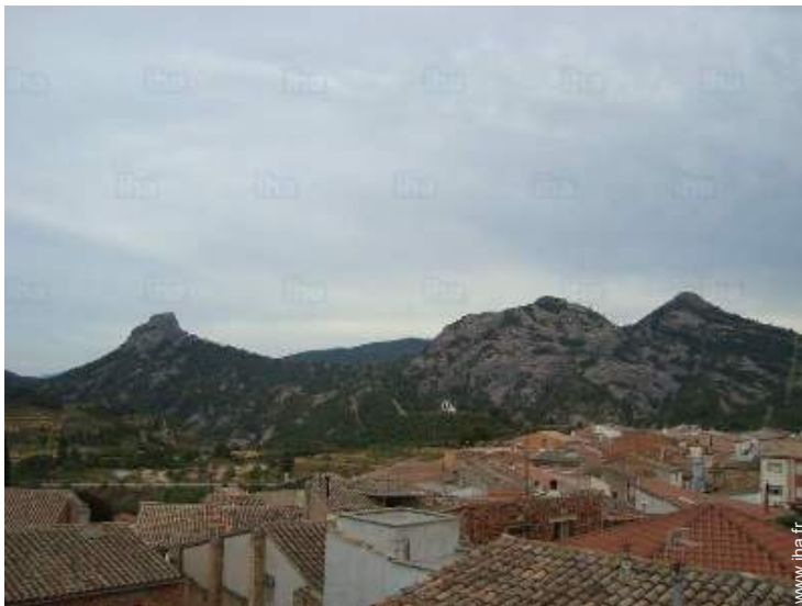
vue depuis la terrasse