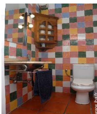
salle(s) de douche