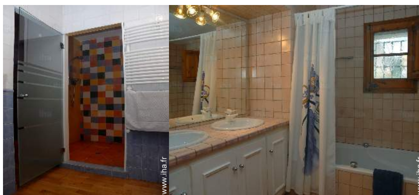
salle(s) de bain