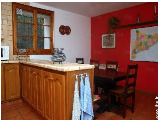
salle à manger