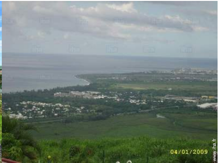
vue de la propriété