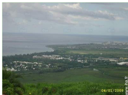
vue de la propriété