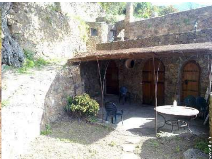
Maison en Pierre