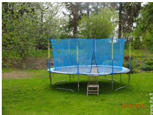
Equipements de loisir