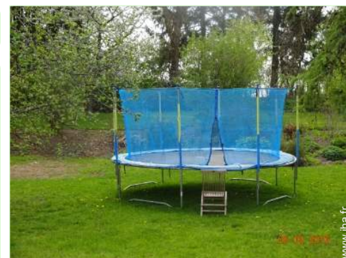
Equipements de loisir