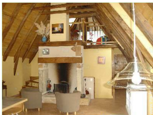
coin du feu