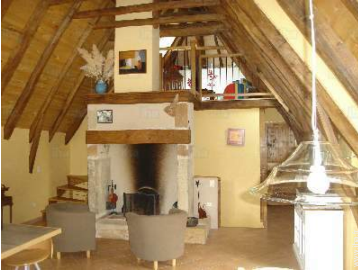
coin du feu