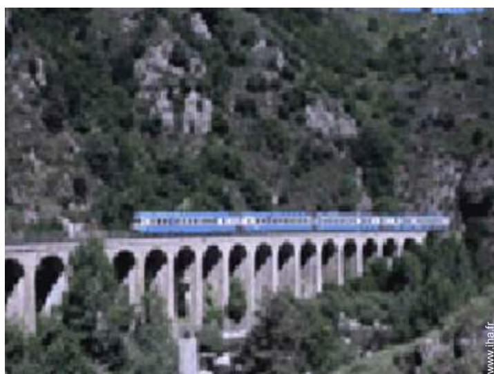
loisirs à proximité