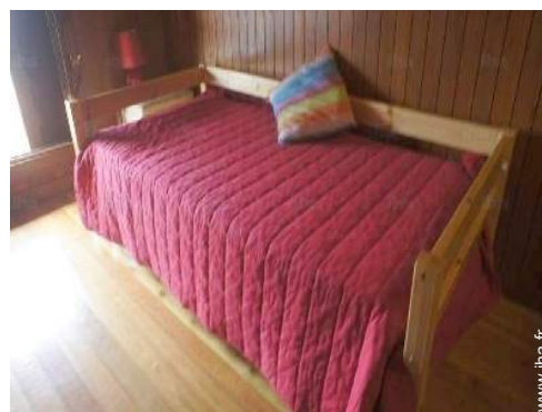
canapé-lit(s) 2 pers