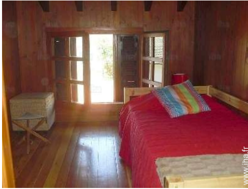
canapé-lit(s) 2 pers