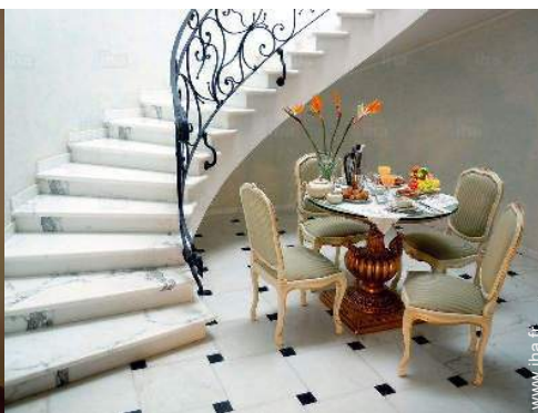
Villa de Prestige