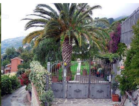
Villa de Prestige