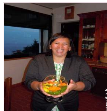
Présence sur place