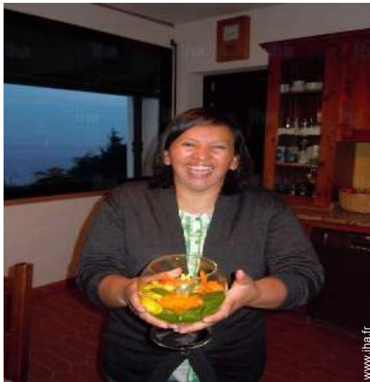
Présence sur place